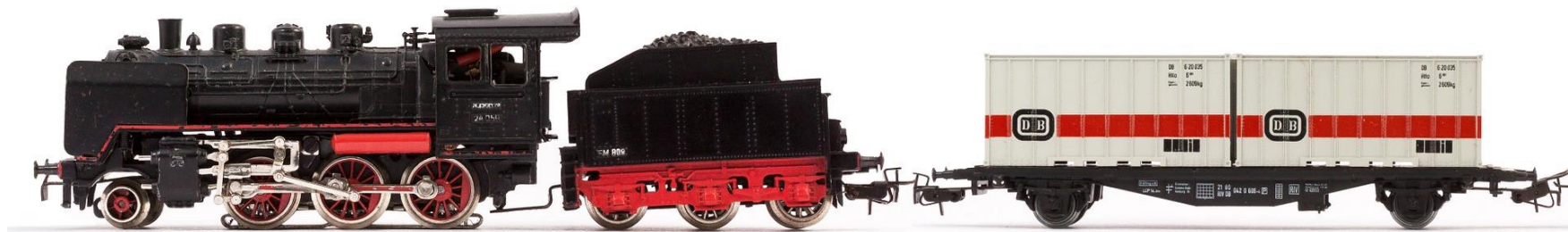
Illustration pour la classe