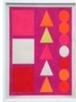
Dimanche 1, 1950, gouache sur papier, 31x26, Galerie Lahumière, Paris