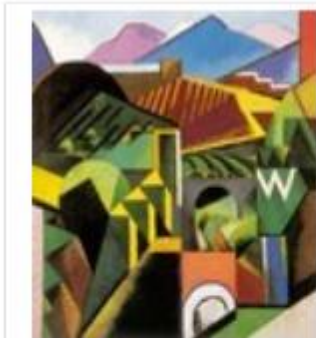
Paysage de Céret 1913, huile sur toile, 94x 91,5, Musée d'art moderne, Céret.