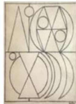
Maison, 1947, mine de plomb, 35x29, Galerie Lahumière, Paris.